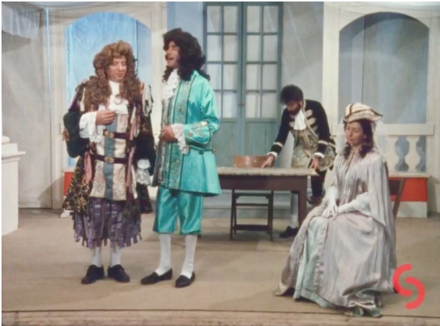
Fig. 8 : Répétition en costumes de la scène 16 du troisième acte. Image tirée de Monsieur Molière aux champs (Capture d'écran).