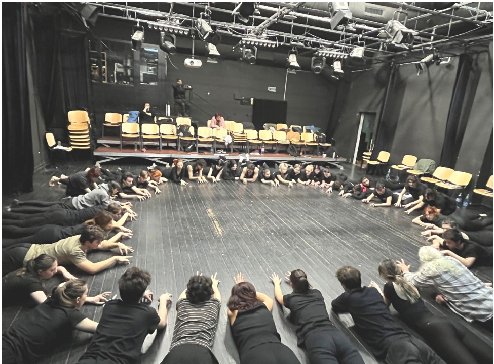
Fig. 2 : Atelier avec les étudiants de FTF Cluj, Mars 2023