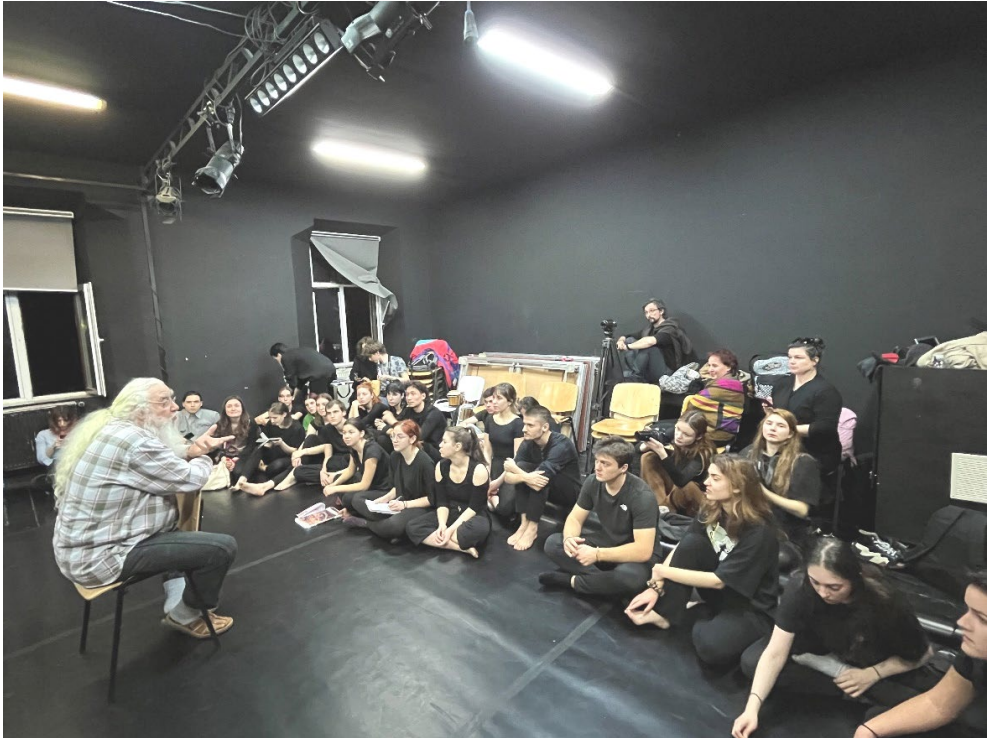
Fig. 1 : Atelier avec les étudiants de FTF Cluj, Mars 2023

montre qu'il y a un ou deux ou plusieurs qui sont en dehors de l'orchestre. Il faut un minimum d' écoute . Alors l' écoute , au lieu d'en parler, il vaudrait mieux la faire, l'exercer.