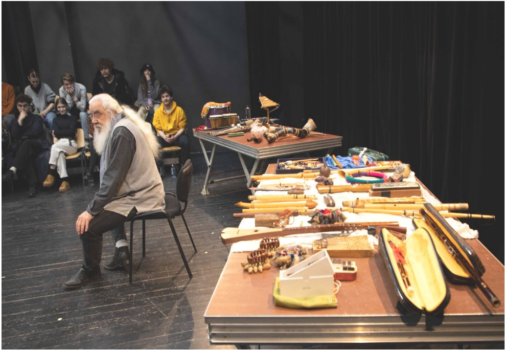
Fig. 3 : Mini concert pluri-instrumental avec les étudiants de FTF Cluj, Mars 2023