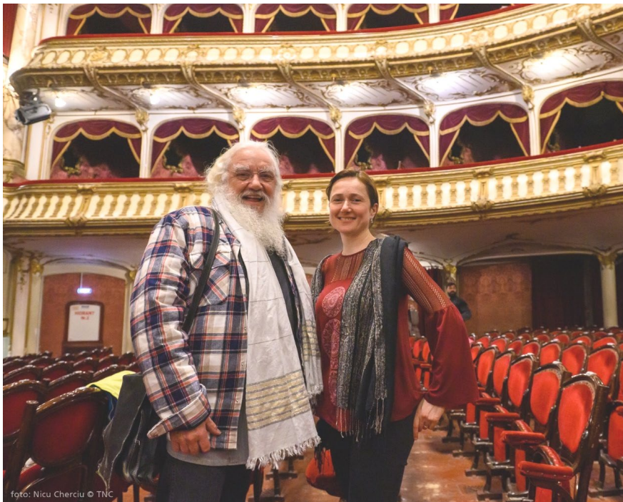
Fig. 4 : Au Théâtre National de Cluj-Napoca, Mars 2023, photo credits Nicu Cherciu.

Jean-Jacques Lemêtre : De ne pas prendre un kawai avec eux, un imperméable, parce qu'il n'a pas de poches, mais un sac à dos qu'il faut continuellement remplir de connaissances. Et d'y aller tranquillement, en pensant que leur entreprise n'est pas utopique, mais qu'elle peut se réaliser, mais sans mettre de contraintes de temps... c'est une formation continue.